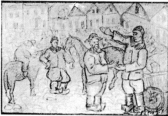
— זעקס הונדערט! זיבן הונדערט! — און ווידער א פאסט אין דער האנט 1 טער טייל, ז' 56

א שמוגלער? — שטעלט זיך יעדער א פראגע. אלע שפירן זיך עפעס געקרעמפירט אין זיין געזעלשאפט. ער באצאלט אבער, און פארויס, וויפל ס'קומט און רעדט א גאנצן וועג נישט קיין ווארט. א ייד — א מלכות. קיינער ווייס אבער נישט, אז די קינדער זינען אוועק קיין אויסלאנד: דאקטוירים, אינווענירן. איין טאכטער נאר געבליבן מיט א קינד ביי דער ברוסט און דער מאן איז אויף דער מלחמה. פייניקט מען זיך שוין העכער א יאר — ס'געשעפט אויפ־געגעסן. האט מען פארקויפט אלץ פון שטוב: קרעדענצן, טישן, שטולן — פאר א שיבוש. און וואס טוט מען ווינטער? די קינדער שרייבן נישט. מוז מען זיך צו עפעס נעמען... „אלע קאנען, וועסטו אויך קאנען...“ האט ער אנגעטאן דעם הארטן הוט, ווי איינער וואס גייט טאן א פבוד־זאך. געפארן אויף א מארקטאג נאך א ביסל אייער, פוטער, מעל און געפירט קיין ווארשע. שטיל, מיט א רויק פנים געגאנגען אין א געוועבל אריין, פארקויפט און דאס פאר-